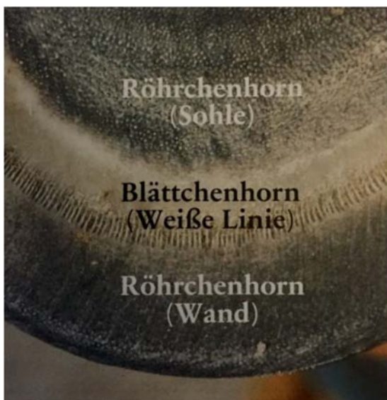
Abb. 9: Huf und Fesselstand,