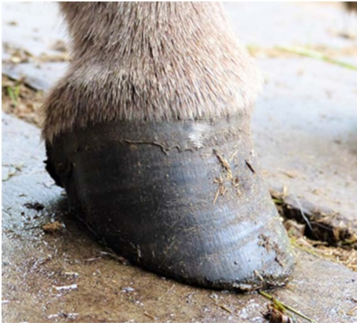
Abb. 7: Korrekte Hufstellung nach Hufpflege