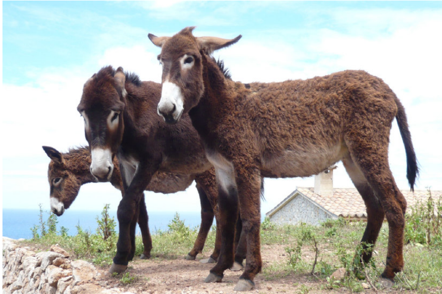
Abb. 2: Esel zeigen eine auffällige Mimik und Körpersprache