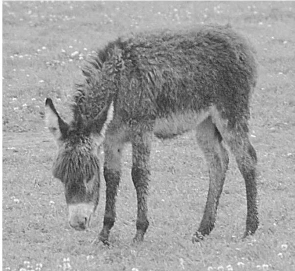
Abb. 5: Das flauschige Fohlenfell saugt sich wie ein Schwamm voll Wasser, wenn das Fohlen nass wird. Leicht kann eine lebensbedrohliche Lungenentzündung die Folge sein.