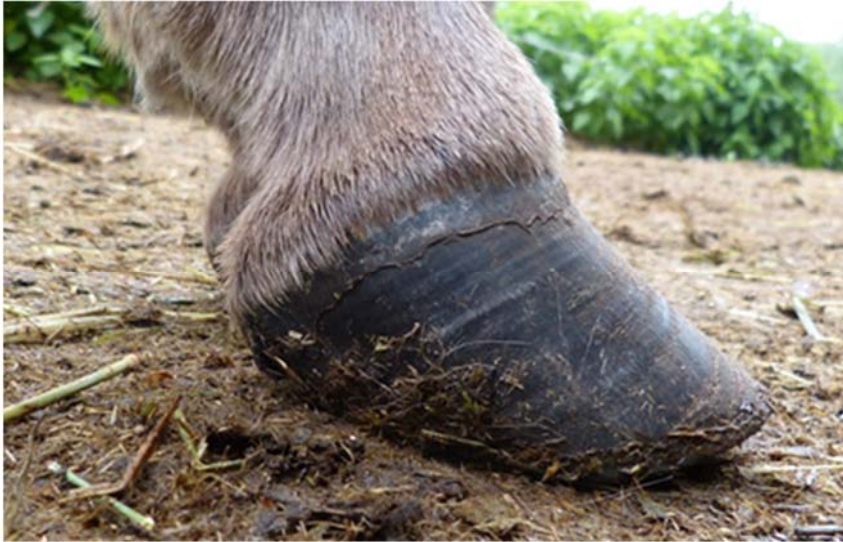
Abb. 6: Esel mit vernachlässigter Hufkorrektur

Ausreichende Bewegung ist für die Erhaltung der Hufgesundheit unerlässlich.